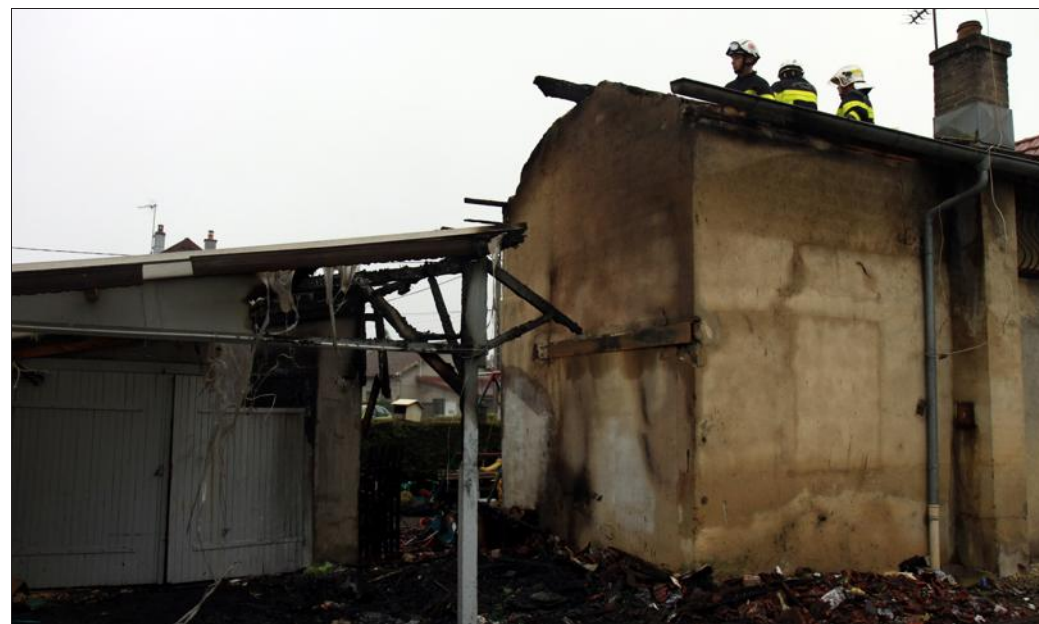
■ La maison, rue du Stade, a été détruite. A la barre, l'habitant et sa fille ont livré un court témoignage mais poignant.

« Quatre personnes dormaient tranquillement. Sans faire de mauvais jeux de mots, elles ont vu leur maison partir en fumée. Après le choc, il y a eu l'incompréhension. L'habitant s'est effondré immédiatement, il ne peut toujours pas faire face. Le lendemain du sinistre, le